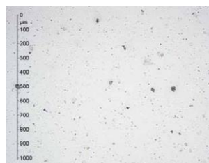
Classe 20/18/15 (ISO 4406) Classe 9 (NAS 1638)

L'élément filtrant agit par absorption de l'eau (jusqu'à 780 ml) et par adsorption des particules (jusqu'à 2,5 kg) dans un processus de recyclage continu. Les longues fibres de cellulose absorbent l'eau (libre et dissoute) formée soit par le processus de combustion ou de condensation/pollution. Permet d'atteindre la classe de propreté 13/11/08 selon ISO 4406 ou classe 2 selon NAS 1638