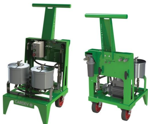
Chariot de filtration AMO-2S500-B