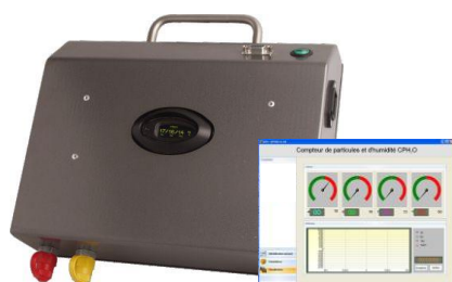
Compteurs de particules