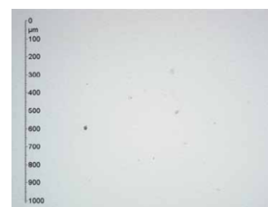
Classe 15/13/10 (ISO 4406) Classe 4 (NAS 1638)