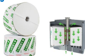
Élément filtrant AMO-SDFCU

L'élément filtrant AMO-SDFCU CARDEV est fabriqué à partir de longues fibres de cellulose, il est équipé avec un disque de protection en polyester sur le diamètre entier. Il peut être utilisé sur tous les fluides à base d'huile tels que l'hydraulique, moteur, boîtes de vitesse, engrenages et les carburants diesel.